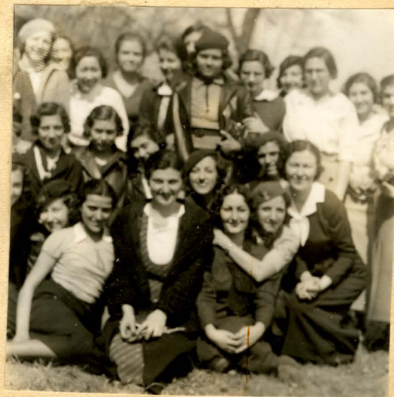
Bronx Italian Club on Hike with Miss Semisa.