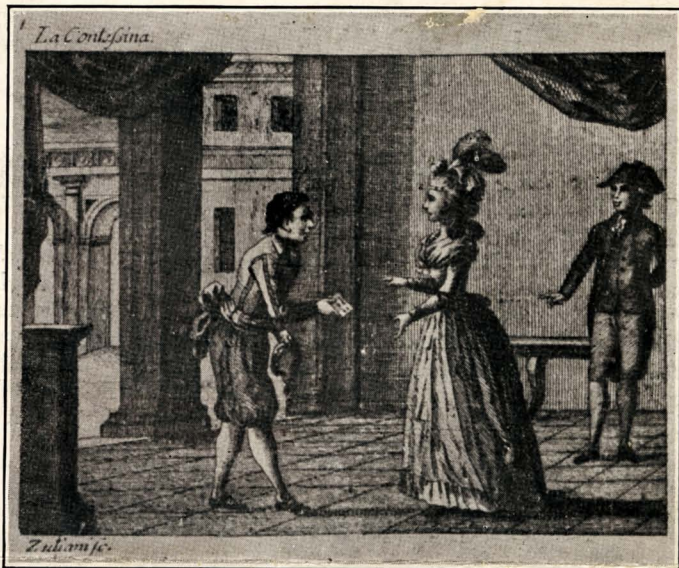
FROM AN EDITION OF 1788

Il Circolo Italiano Hunter College of the City of New York presents La Contessina by Carlo Goldoni