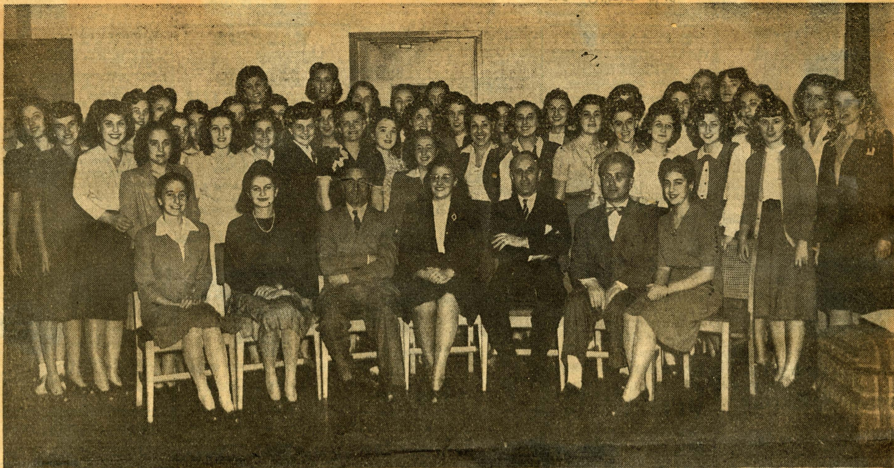
(Servizio Speciale del "Progresso")